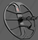
Bobina EQX15™ con placa de deslizamiento doble D elíptica de 15"x12" – Sumergible a 5 m [16 pies]