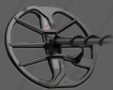
Bobina EQX11™ con placa de deslizamiento Doble D redonda de 11" – Sumergible a 5 m [16 pies]